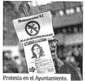
Protesta en el Ayuntamiento.